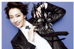
● 9/13～10/1 紅ゆずる