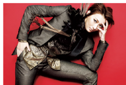
● 8/24～9/11 珠城りょう

※展示スケジュールは変更になる場合がございます。 ※展示観覧のみでの店内へのご入場はご遠慮ください。